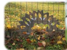
Passage à hérisson

Il est assez facile de recréer des abris pour de nombreuses espèces. Du gros bois mort peut faire office d'hôtel à insectes, un tas de branches attirera également insectes et oiseaux. Un petit trou dans la clôture permettra aux hérissons de passer de jardin en jardin. Attention si vous avez un chat car leur impact sur la faune sauvage est non négligeable. Pour limiter les dégâts lors de ses parties de chasse, vous pouvez le stériliser, veiller à bien le nourrir et éviter de le laisser sortir la nuit.